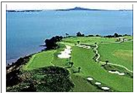
** THE FORMOSA AUCKLAND COUNTRY CLUB **

หลังอาหารค่ำท่านสามารถพักผ่อนและย่อยอาหารได้ที่ SKY CITY & CASINO ซึ่งหลากหลายไปด้วยความบันเทิง, โชว์ตระการตาหรือเสียงไซดที่คาลิโนอันหรรษา