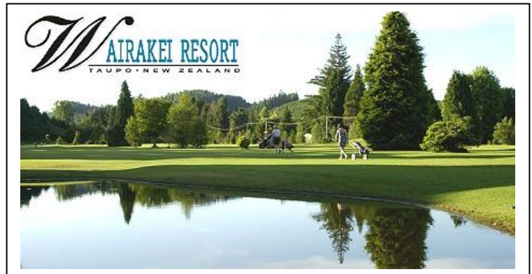
** WAIRAKEI GOLF CLUB **

เราสร้างความประทับใจ ในความแตกต่าง ด้วย “คุณภาพ” และ “บริการ”