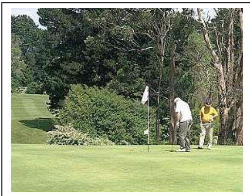
** THE GRANGE GOLF CLUB **